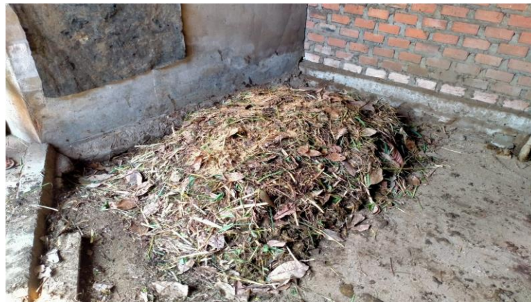
Gambar 1. Dokumentasi Pelatihan Pembuatan Pupuk Organik

Proses penguraian yang cepat berguna untuk menghasilkan pupuk organik dengan cepat dan baik dengan melihat tingkat kematangan yang tepat untuk mengurangi kemungkinan fitotoksi pada tanaman nantinya. Menurut manfaatnya pupuk dibedakan menjadi dua jenis yaitu pupuk organik dan pupuk anorganik. Kedua jenis pupuk tersebut mempunyai kelemahan dan kelebihan. Pupuk organik memiliki kelebihan dapat memperbaiki sifat kimia dan fisika tanah meskipun dalam penggunaannya dibutuhkan jumlah yang cukup besar dibandingkan pupuk anorganik untuk luasan lahan yang sama. Pupuk anorganik langsung dapat dengan lebih mudah terserap oleh tanaman, mudah terurai namun terdapat juga kelemahannya yaitu harga pupuk anorganik tergolong tinggi dan dapat menyebabkan tanah menjadi keras serta mengurangi keberlanjutan pertanian secara umum, (Purnomo, 2013).