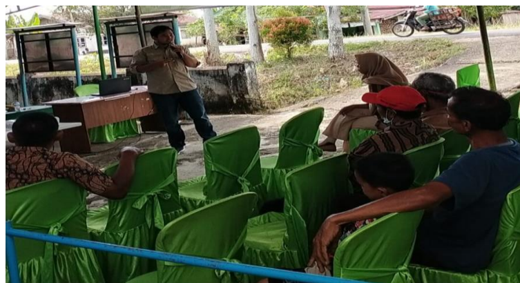
Gambar 1. Kegiatan Penyuluhan

Pelaksanaan kegiatan pengabdian kepada masyarakat telah berjalan sesuai rencana yang terdapat dalam metode pelaksanaan. Kegiatan ini dilaksanakan oleh Tim Pengabdian Program Peternakan Fakultas Pertanian Universitas Musi Rawas, dan melibatkan mahasiswa. Keterlibatan mahasiswa dalam kegiatan ini meliputi: membantu proses identifikasi permasalahan, menyusun perencanaan kegiatan, mempersiapkan sarana dan prasarana, daftar hadir kegiatan, mendampingi dosen dan peserta saat penyuluhan/pelatihan, dokumentasi kegiatan dan membantu mengumpulkan data dalam melaksanakan kegiatan.