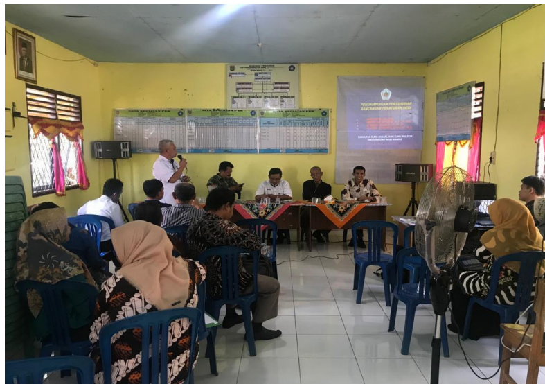
Gambar 4. Penyampaian Materi Oleh Tim Pelaksana