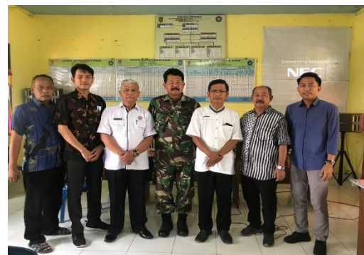
Gambar 5. Foto Bersama Setelah Proses Evaluasi Selesai