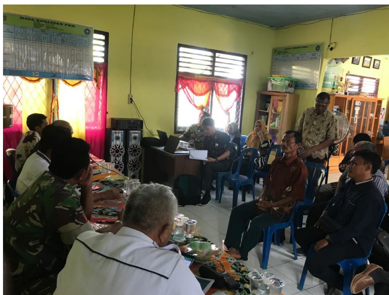
Gambar 3. Persiapan Untuk Melakukan Pendampingan

Pada tahap persiapan ini tentu pelaksana menyiapkan segala hal kebutuhan dalam melakukan pendampingan penyusunan peraturan desa. Persiapan itu sendiri berupa pembuatan materi tentang dasar hukum peraturan desa, tujuan pendampingan desa, asas teknik dan proses penyusunan peraturan desa, dan landasan penyusunan peraturan desa atau peraturan perundang-undangan. Selanjutnya, selain dari persiapan materi tersebut pelaksana membuat kebutuhan administratif baik itu daftar hadir, surat yang ditujukan oleh kepala desa, serta menyusun justifikasi anggaran yang digunakan dalam pelaksanaan pendampingan. Setelah melakukan persiapan berupa materi dan kebutuhan administrasi lainnya tim pelaksana menyebar surat menyurat kepada kepala desa, kemudian mencetak segala hal kebutuhan administrasi baik daftar hadir, materi, dan segala hal yang dibutuhkan.